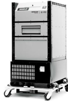
Сканнер QEM Scan Well Site